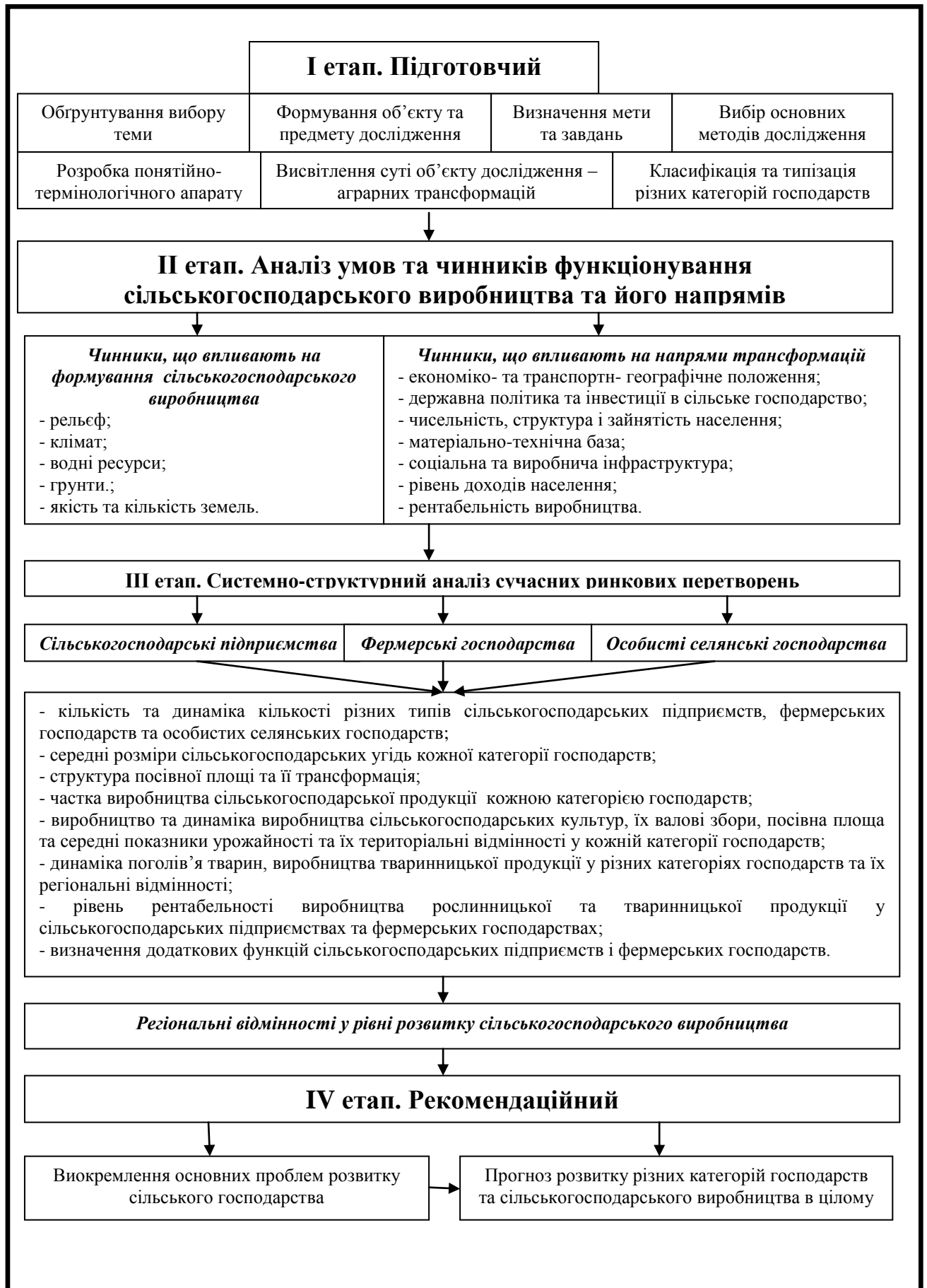
Рис.1. Етапи дослідження сучасних трансформаційних процесів сільськогосподарського виробництва